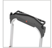
Tablette porte-outils multifonction sur les 3 et 4 marches