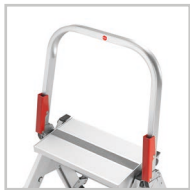
Garde-corps sur le 2 marches