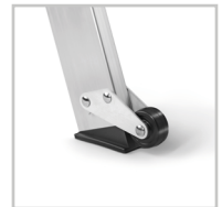
Roues de déplacement